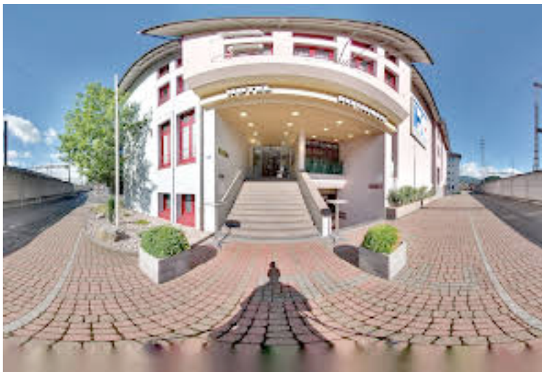
Hôtel Olten 1 minute à pied depuis la gare par Winkelunterführung

Olten 10h00 Départ : Chur 08:08 / Buchs 08:15 / St. Gallen 08 :07 / Schaffhausen 08:47 Olten 10h18 Départ : Genève 08 :15 / Neuchâtel 09 :26 Olten 10h21 Départ : Zürich 09 :38 / Winterthur 09 :09 / Frauenfeld 08:48 / Olten 10h24 Départ : Aarau 10 :13 / Baden 09:47 / Olten 10h25 Départ : Basel 09 :55 / Olten 10h28 Départ : Luzern 09:54 / Lugano 08 :01 Olten 10h30 Départ : Lausanne 08 :44 / Bern 10 :04 /